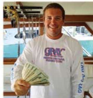
Catlin Peele Hatteras Fever II—Hatteras Harbor

A pesar de que las salidas bajaron durante el invierno aquí, todavía estoy emocionado por los que aprendieron y se aprovecharon de hacer montadas este verano. Sé que va a guardar sus técnicas para trabajar en la temporada baja, y así sigan teniendo un buen ingreso adicional durante todo el año. Buena suerte a todos!