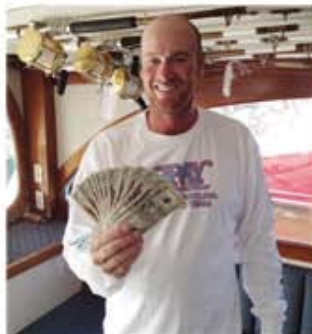
William Spence Osprey—Oregon Inlet