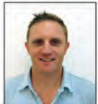
Jonas Internet Specialty