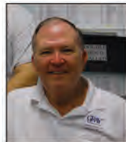
Terry Customer Service