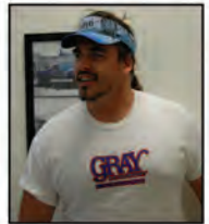
Scott Lauderdale Area