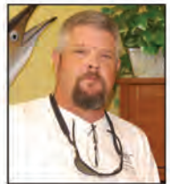
"Mango" SE Regional Mgr